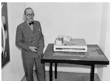
1. Ville Savoye, Poissy (Le Corbusier 1928-29)

Desta aceção primordial da habitação enquanto topos do hábito resulta uma possível reorganização taxonómica da arquitetura, de que tiraremos partido para pensar o espaço escolar como casa.