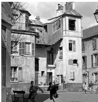
2. Casa do Sr. Hulot

declarado de Ábalos é relativizar o modelo positivista, que identifica como o que mais influência produziu (e produz) sobre o projeto do espaço que se quer habitável. Criticar na medida em que julga o modelo desadequado, insuperado apenas porque é também ainda positivista a formação do arquiteto e intrinsecamente normativa a construção. Ábalos fala da “casa-tipo” modernista mas também de outros 'tipos de casas', correspondentes a diferentes concepções do habitar e igualmente distintas aceções das qualidades do público e do privado.