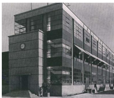
6. Fábrica Fagus, Alfeld (Walter Gropius, 1910-11)

Público e privado debatem-se ainda de outras formas na escola/casa contemporânea, como se debateram também na casa modernista. O paradigma da visibilidade, que atinge o paroxismo na casa Farnsworth de Mies van der Rohe, revela-se na escola contemporânea. Sobre a utilização do vidro no modernismo escreve Ábalos: “ Em poucos momentos terão coincidido de forma tão feliz, como neste, a ascensão dos valores ideológicos – a visibilidade positivista – e o surgimento de uma tecnologia e de um material ” 10 . O protótipo da escola moderna, um dos mais aclamados exemplares da arquitetura da primeira metade do século XX, já tinha sido, à época, admirado pelo uso do vidro, tão simbólico quanto funcional. A fachada do edifício das oficinas da Bauhaus em Dessau, concebido por Walter Gropius e cuja construção se iniciou em 1925, fazia a escola parecer uma enorme massa brilhante e transparente. Quem se aproximava da escola via, a partir do exterior, os corredores de acesso às oficinas, quem circulava nesses corredores tinha uma visão ampla do exterior, e para além dos óbvios benefícios funcionais (abundante entrada de luz natural e otimização da ventilação natural) esta visibilidade era também ideológica. Tratava-se afinal do edifício do futuro, estrutura redentora anunciada no manifesto de fundação desta escola seis anos antes 11 .