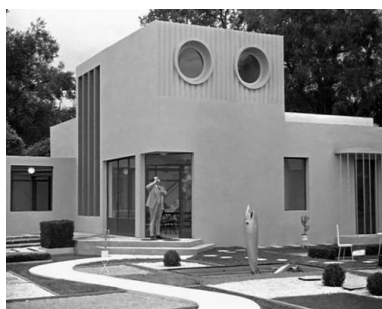
3. Villa Arpel (Jacques Lagrange, 1958)

A casa positivista é a casa moderna, a casa-máquina-de-habitar corbusiana, a casa racional e super eficiente. É a casa-vitrine, lugar de exposição da família, espaço que se define pela sua utilização coletiva (por uma comunidade), e portanto deve conciliar várias esferas de privacidade, e que ambiciona ainda contribuir para a conformação do espaço público, no limite, o desenho da própria cidade.