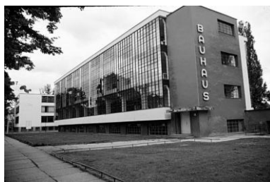
5. Oficinas da Bauhaus, Dessau (Walter Gropius, 1924-25)