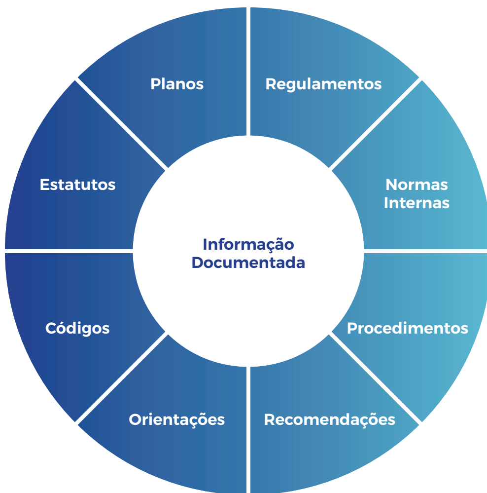
Figura 1 - Harmonização documental

Este é um documento “vivo”: reflete a situação do sistema na data em que é reeditado, mas está permanentemente em construção (seja pela introdução de novos procedimentos e práticas, seja pela sua correção). É revisto sempre que se justifique, procedendo a uma harmonização documental do sistema.