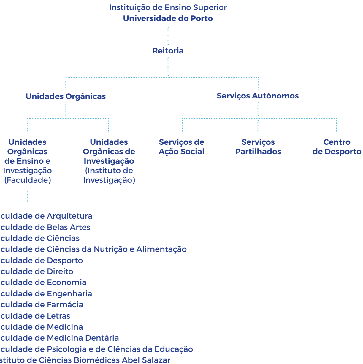
Figura 2 - Organização da Universidade do Porto