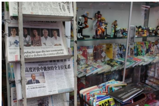
Figura 4 - Jornais em língua japonesa, mangás e bonecos de personagens da cultura pop japonesa em banca de jornais. Freguesia da Liberdade – SP