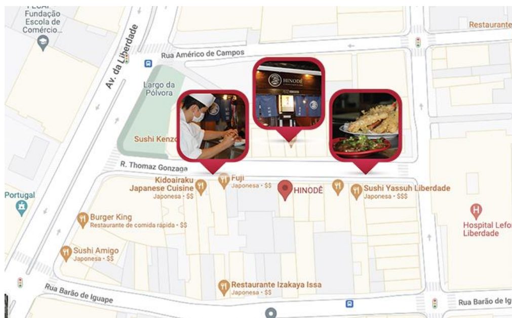
Figura 31 Localização do restaurante 'Hinodê', na freguesia da Liberdade – SP

fora dos pratos. Nosso primeiro contato com o restaurante foi através de pesquisas sobre restaurantes japoneses tradicionais e antigos na freguesia.