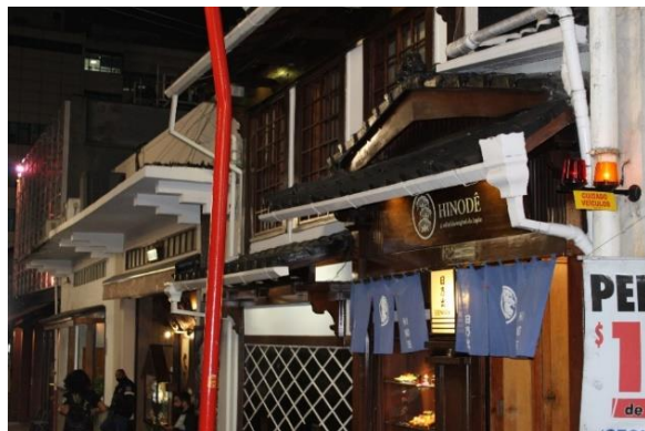
Figura 37 Fachada do restaurante Hinodê em estilo tradicional japonês miyadaiku. Freguesia da Liberdade – SP