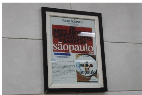
Figura 60 Reportagem ‘Os melhores restaurantes e bares de São Paulo - 2011’, do jornal Folha de SP. Restaurante Raful. Freguesia da Sé – SP

Ademais, analisamos que a junção gastronômica proposta pelo estabelecimento agrada não somente o público que o frequenta, mas também é reconhecida por críticos e cadernos gastronômicos que elegem o Raful como um dos melhores da cozinha árabe em São Paulo (ver Figuras 60 e 61).