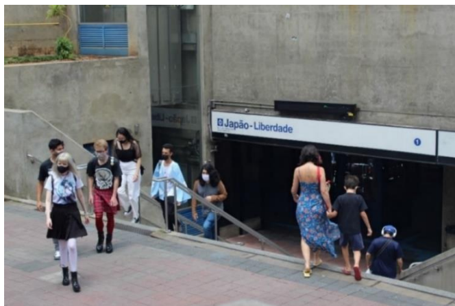
Figura 3 Entrada da estação de metrô Japão-Liberdade. Freguesia da Liberdade – SP