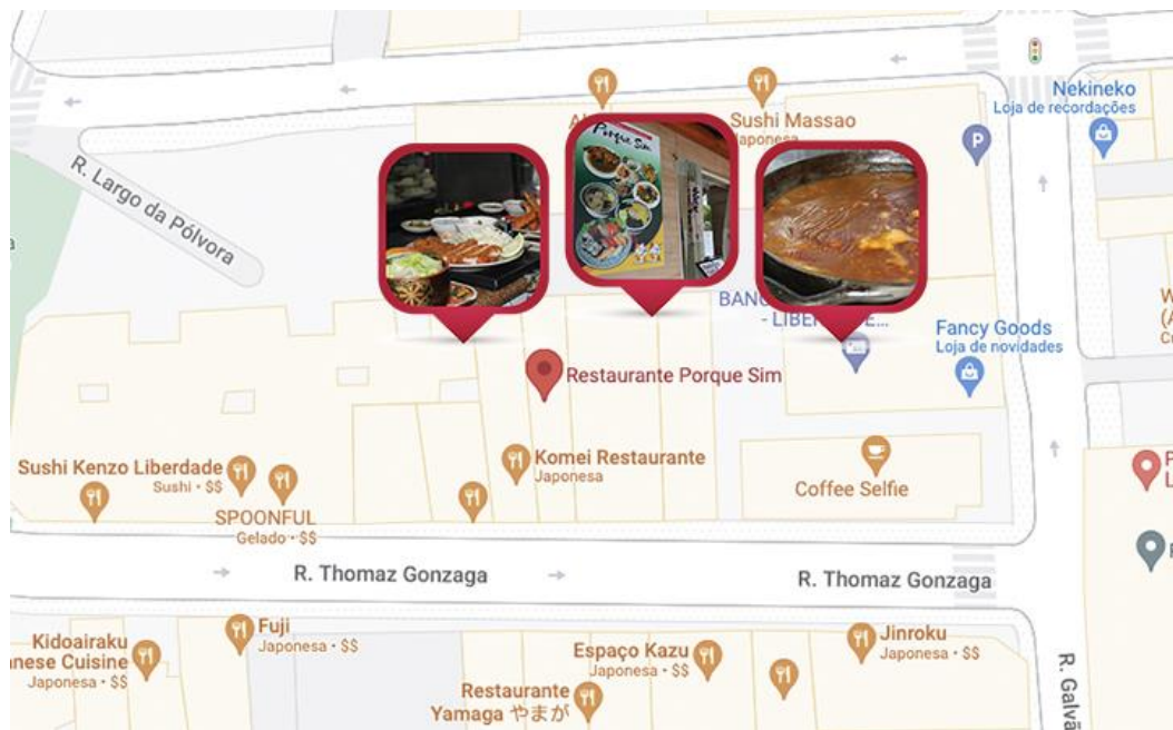
Figura 22 Localização do restaurante Porque Sim, na freguesia da Liberdade – SP

Localizado na freguesia da Liberdade, mais especificamente na rua Thomaz Gonzaga, o restaurante Porque Sim é o mais novo estabelecimento dos restaurantes visitados para este estudo, apesar de ser um dos mais reconhecidos pela comunidade japonesa no que se refere à cozinha tradicional (ver Figura 22), algo que se tornou visível para nós devido à afluência denotada aquando as incursões de observação direta e etnográficas.