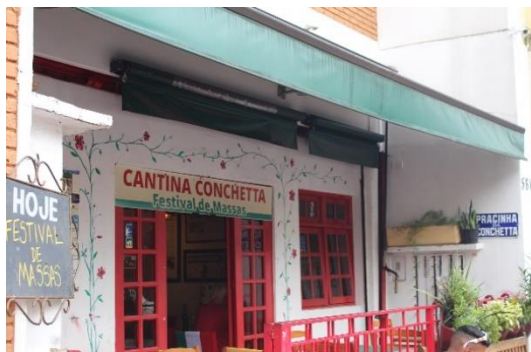
Figura 15 - Típica cantina italiana do Bixiga. Bixiga – SP