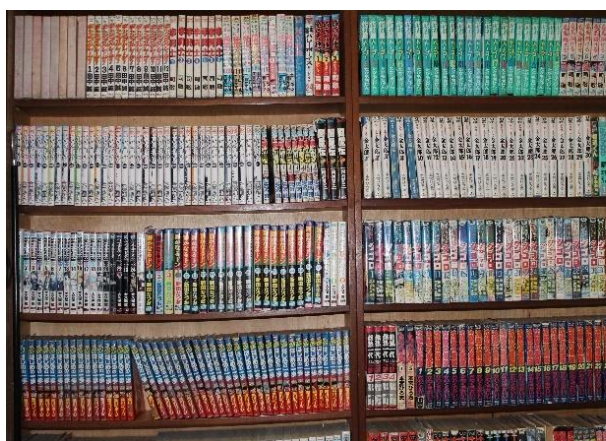
Figura 27 Estante repleta de mangás, no restaurante Porque Sim. Freguesia da Liberdade – SP