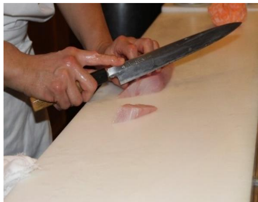
Figura 34 Técnica e preparo do sashimi, no restaurante Hinodê. Freguesia da Liberdade – SP