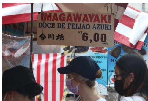
Figura 12 - Barraca de doce típico japonês na Feira da Liberdade. Freguesia da Liberdade – SP