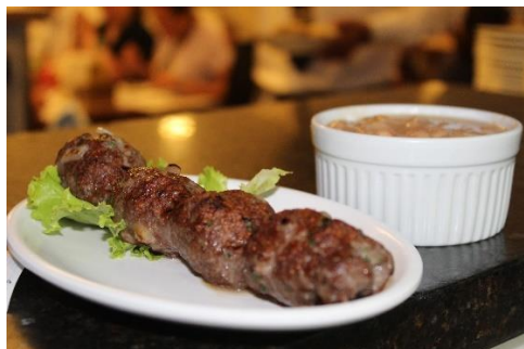
Figura 57 Tradicional kafta acompanhada de feijão brasileiro. Restaurante Raful. Freguesia da Sé – SP