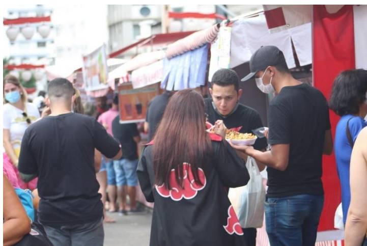
Figura 13 - Jovens com vestimentas que fazem alusão à animes, na feira da Liberdade – SP

de observação, cosplayers 23 e otakus 24 estavam entre os transeuntes da Liberdade, mesmo não havendo eventos específicos relacionados com animes 25 ou correlacionados nestas ocasiões (ver Figura 13). Deste modo, nos é demonstrado a expressividade cultural da freguesia, uma vez que oferece possibilidade destas pessoas viverem experiências que as aproximem mais do universo japonês do qual se identificam. Isso lhes é proporcionado através da própria estética local, do oferecimento de produtos e outros goods 26 por estabelecimentos especializados, bem como na gastronomia típica presente nos restaurantes e Feiras.