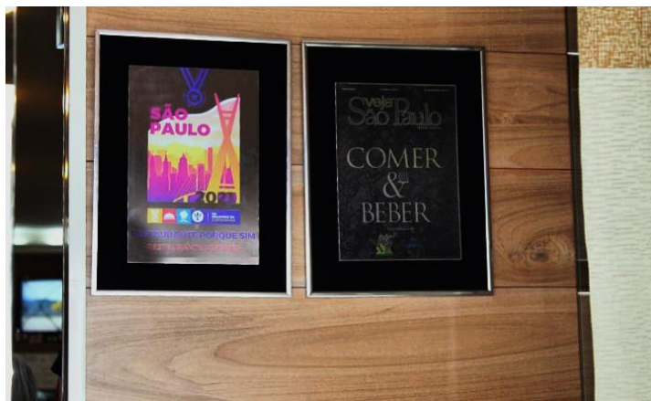
Figura 30 Selos dos guias gastronômicos ‘Os melhores da gastronomia’ e ‘Comer e Beber’, conferidos ao ‘Porque Sim’. Freguesia da Liberdade – SP