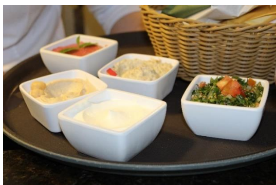
Figura 52 Kibe cru acompanhado de coalhada e humus, no restaurante Raful