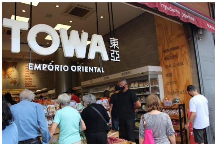
Figura 5 - Empório de ingredientes asiáticos. Freguesia da Liberdade – SP

Atualmente, a região é voltada a cultura asiática de modo geral. Porém, apesar da grande oferta de culinárias orientais, como chinesa, coreana, tailandesa, entres outras, é a gastronomia japonesa que carrega e mantém o reconhecimento popular da Liberdade como bairro nipônico.