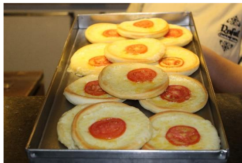
Figura 58 Tradicional esfiha coberta com mozzarella. Restaurante Raful. Freguesia da Sé – SP.