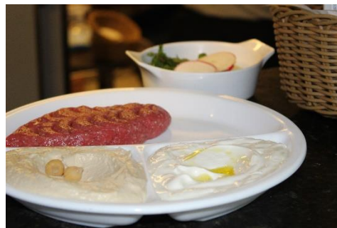
Figura 51 Pequenas porções de kibe cru, babaghanoush, tabule, homus e coalhada. Restaurante Raful. Freguesia da Sé – SP