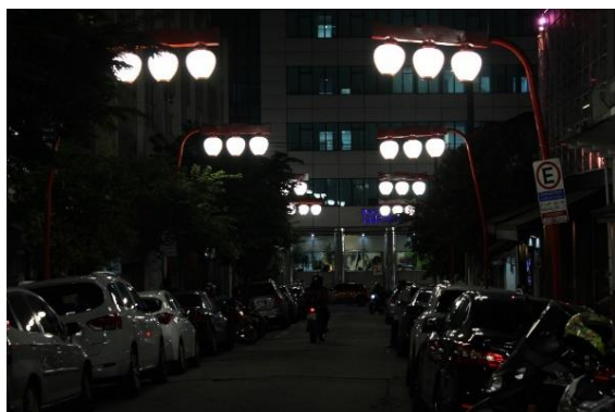
Figura 6 - Rua Thomaz Gonzaga e Suzurantos. Freguesia da Liberdade – SP

restaurante Porque Sim, Liberdade, 2022) 20 . Além disso, os restaurantes japoneses mais antigos e tradicionais da Liberdade estão localizados nesta mesma rua (ver figuras 6, 7 e 8).