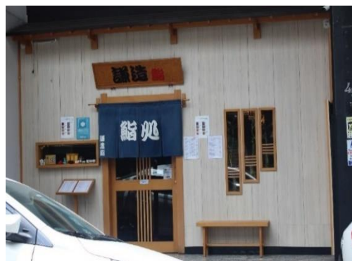
Figura 7 - Restaurante japonês na Rua Thomaz Gonzaga. Freguesia da Liberdade – SP