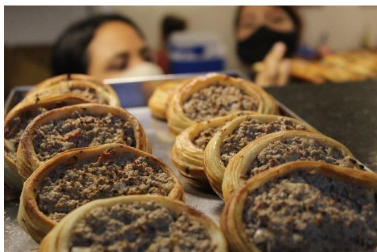
Figura 59 Esfiha de carne com massa folhada: o carro chefe do Raful. Freguesia da Sé – SP