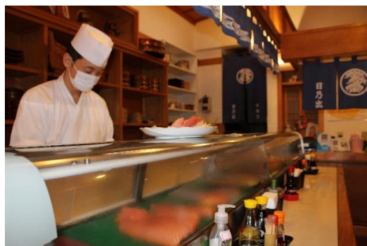
Figura 38 Balcão de preparos e cadeiras para clientes. Restaurante Hinodê. Freguesia da Liberdade – SP