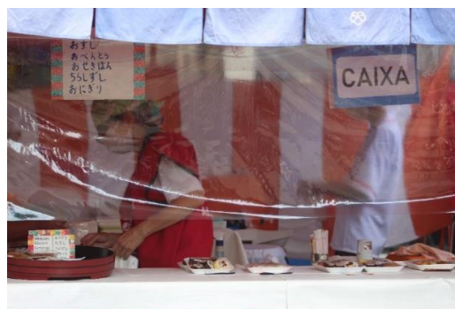
Figura 10 - Barraca de comida típica e avisos em ideogramas japoneses. Freguesia da Liberdade – SP