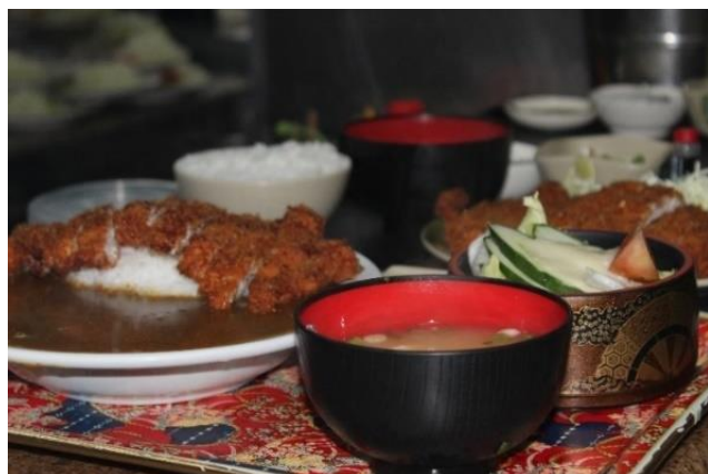
Figura 23 Teishoku preparado no restaurante Porque Sim. Freguesia da Liberdade – SP