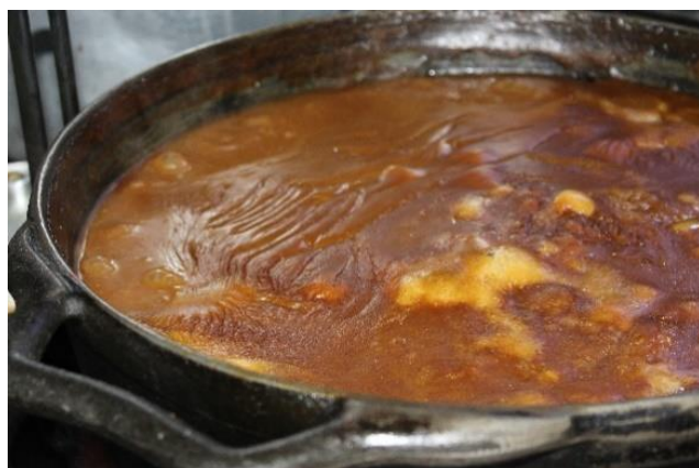
Figura 24 Karê: tradicional prato do Porque Sim. Freguesia da Liberdade – SP