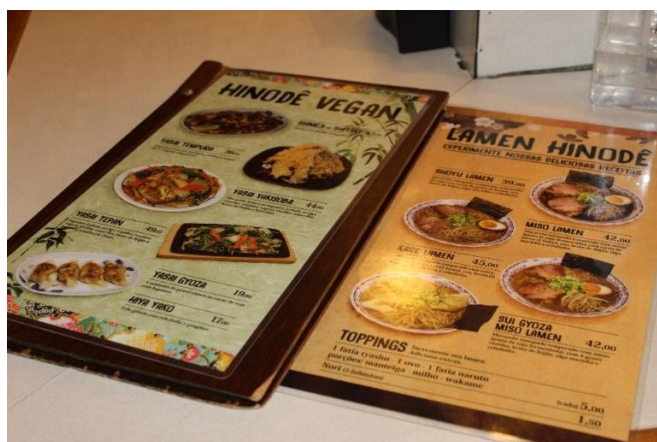
Figura 32 Adaptações culinárias no cardápio do 'Hinodê'. Liberdade – SP