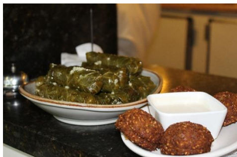
Figura 50 Porção de malfouf e falafel, no restaurante Raful. Freguesia da Sé