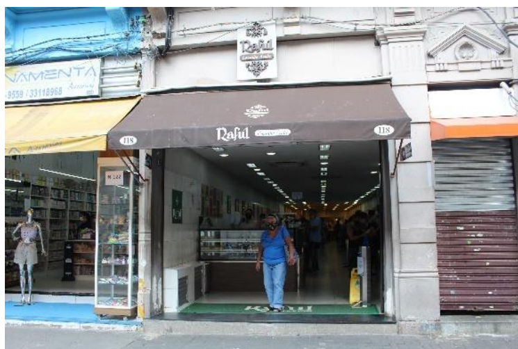
Figura 21 - Restaurante de origem libanesa 'Raful'. Freguesia da Sé – SP