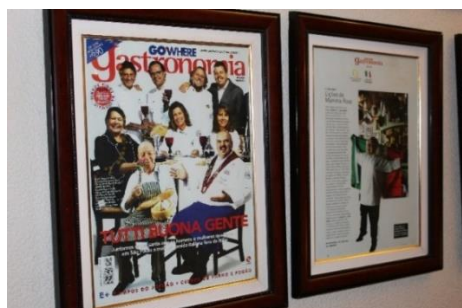
Figura 46 Reportagens feitas sobre a representatividade italiana da Cantina C... Que Sabe! Freguesia do Bixiga – SP