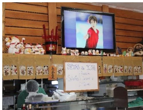
Figura 26 Televisor sintonizado em canal japonês, no restaurante Porque Sim. Freguesia da Liberdade – SP