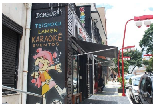
Figura 8 - Restaurante e Karaokê na Rua Thomaz Gonzaga. Freguesia da Liberdade – SP