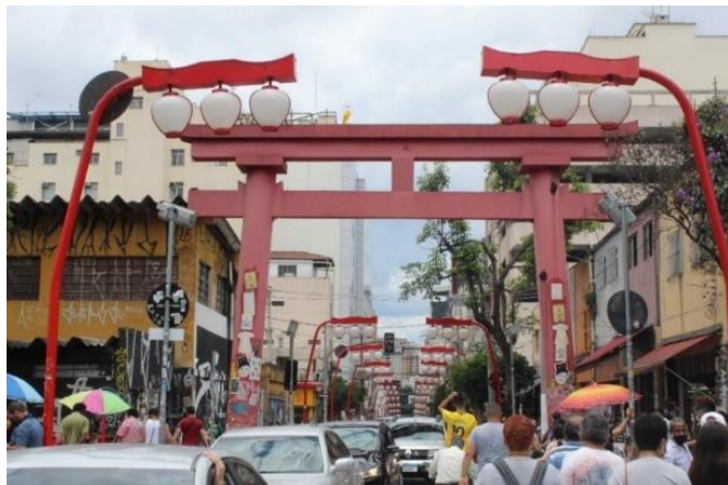
Figura 2 - Suzurantos e Torri ao longo do viaduto Cidade de Osaka. Freguesia da Liberdade – SP