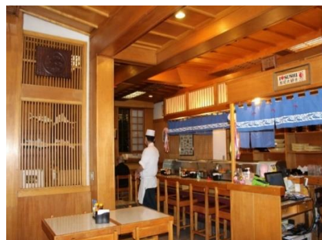
Figura 39 Salão do restaurante Hinodê. Freguesia da Liberdade – SP