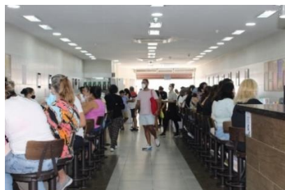
Figura 54 Visão do salão da frente e balcões do restaurante Raful. Freguesia da Sé – SP