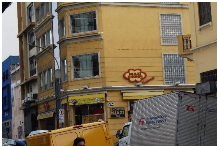
Figura 20 - Tradicional loja 'Niazi Chohfi', em funcionamento há 90 anos na região da rua 25 de março. Freguesia da Sé – SP