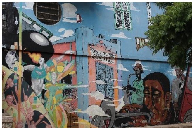
Figura 19 - Graffiti que faz alusão à musicalidade afrodescendente da freguesia. Bixiga – SP.