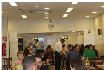
Figura 53 Vista do salão ao fundo do restaurante Raful. Freguesia da Sé – SP