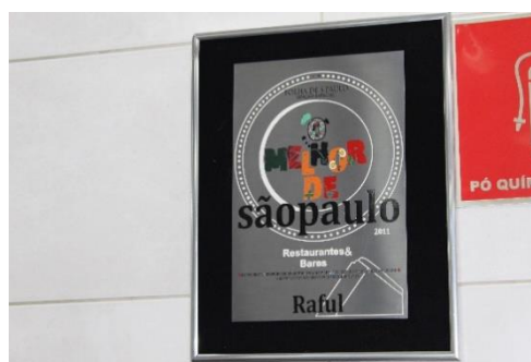
Figura 61 Selo de indicação ‘O melhor de São Paulo - 2011’, do jornal Folha de SP. Restaurante Raful. Freguesia da Sé – SP