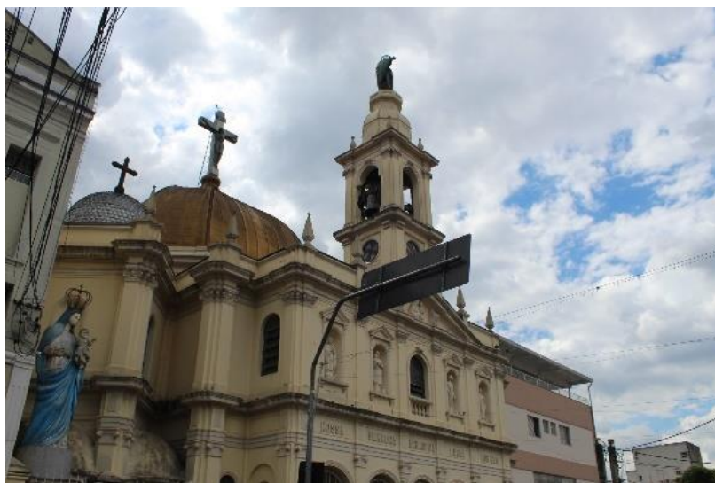
Figura 14 - Vista lateral Paróquia Nossa Senhora da Achiropita. Bixiga – SP