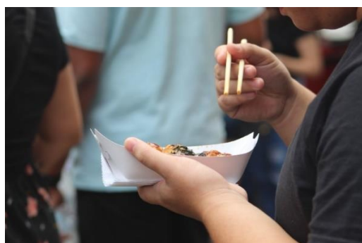
Figura 11 - Público come comidas típicas. Freguesia da Liberdade – SP