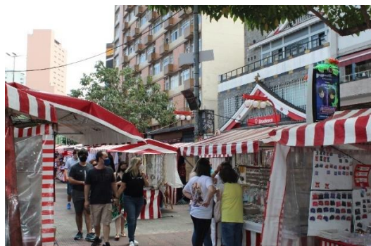
Figura 9 - Visão geral da Feira da Liberdade. Freguesia da Liberdade – SP