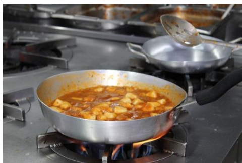
Figura 44 Preparo do Gnhocci, na Cantina C... Que Sabe! Freguesia do Bixiga – SP