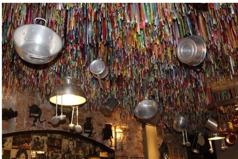
Figura 41 Decoração típica da Cantina, inspirada nas festas do sul da Itália. Freguesia do Bixiga.

trattorias , assim como vimos anteriormente no sub-subcapítulo 5.1.2., as cantinas são estabelecimentos informais que vendem vinhos e pequenas porções, e que servem como uma “parada de descanso” para viajantes. Stippe explica que este modelo de funcionamento foi o início do negócio da família, criado justamente para atender à comunidade italiana neste sentido. O grande diferencial das cantinas e fator que as transformou em um tipo de segmento dentro da gastronomia italiana na cidade de São Paulo, é a sua decoração inspirada nas festas do sul da Itália e que, por suas cores e peculiaridades, tornou-se típica deste tipo de estabelecimento (ver Figura 41).