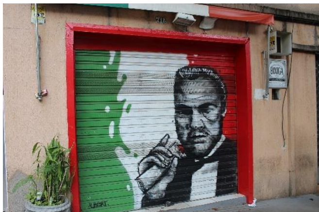
Figura 18 - Graffiti do clássico personagem Vito Corleone, de 'O Poderoso Chefão', a comer um cannoli. Bixiga – SP