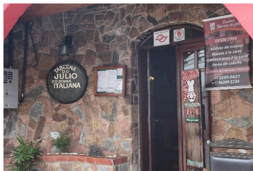
Figura 16 - Cantina 'Taberna do Julio'. Bixiga – SP