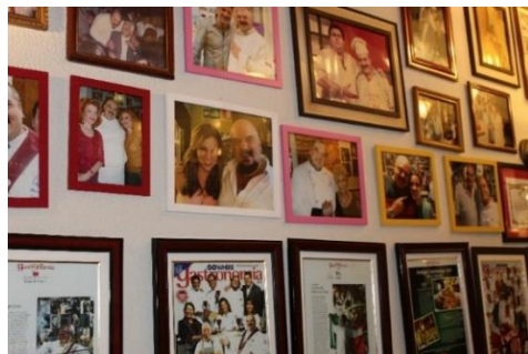
Figura 48 Fotografias de famosos e personalidades de relevância cultural que visitaram a Cantina C... Que Sabe! Freguesia do Bixiga