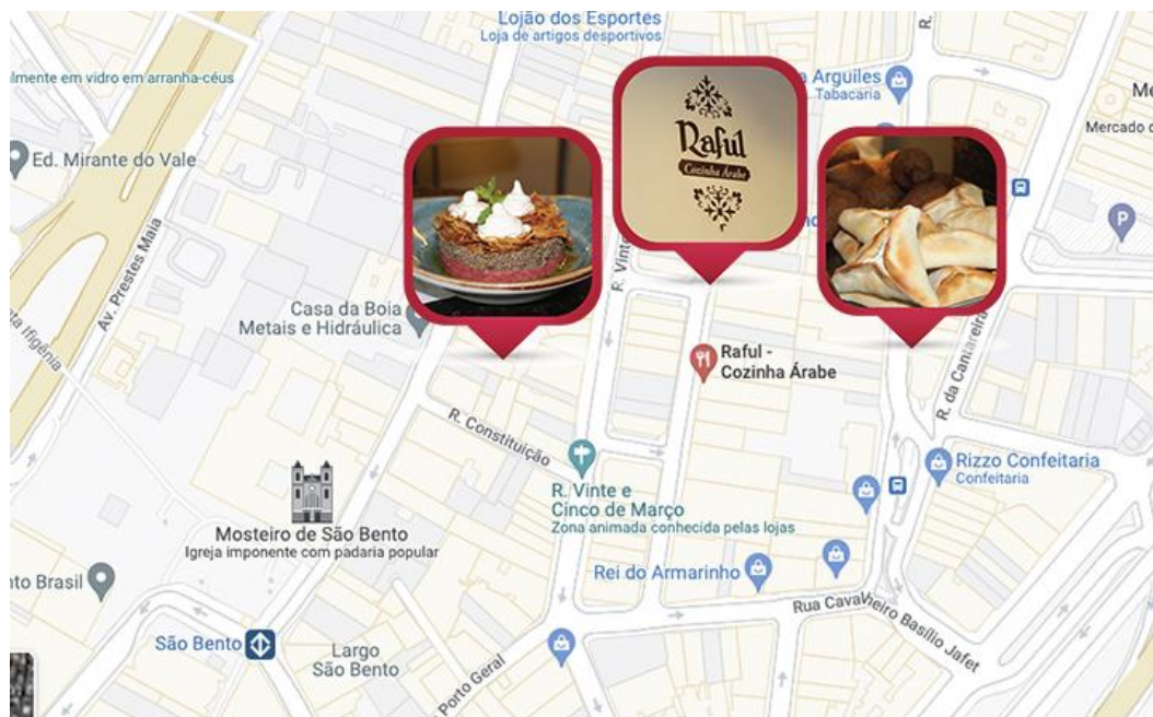
Figura 49 Localização do restaurante Raful. Freguesia da Sé – SP