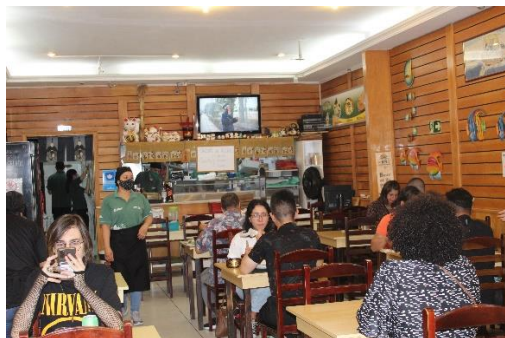
Figura 28 – Visão geral dos clientes no restaurante Porque Sim. Freguesia da Liberdade – SP