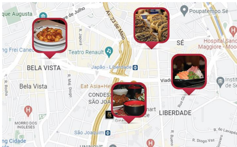
Figura 1 - Mapa geral da localização das freguesias Liberdade, Sé e Bela Vista (Bixiga) e suas culinárias imigrantes

Apesar de provirem da mesma região, cada uma das freguesias possui particularidades estéticas e culturais próprias, que se assumem como um fruto do hibridismo cultural e cosmopolita da contemporaneidade (Hall, 2006), e que se perpetuam como características referenciais e identitárias ao longo do tempo. Para a nossa análise, primeiramente, apontamos em um mapa a localização das freguesias selecionadas para, posteriormente, levantarmos a presença de restaurantes da gastronomia de prisma imigrante. As três freguesias aqui citadas encontram-se na região central da cidade de São Paulo, sendo vizinhas umas das outras, conforme é possível identificar na figura 1.