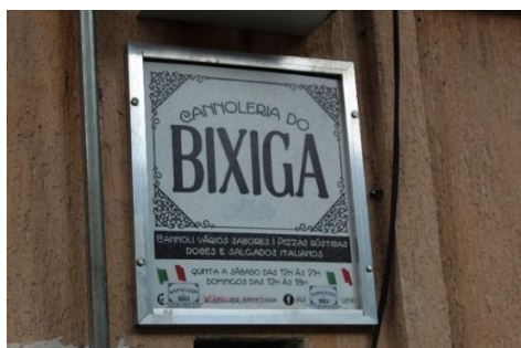
Figura 17 - Casa especializada na fabricação e venda de Cannolis: doce italiano típico da Sicília. Bixiga – SP