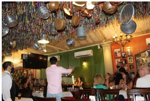
Figura 42 Interação festiva durante a tarantella. Cantina C... Que Sabe! Freguesia do Bixiga – SP

Inspirada na tarantella – dança folclórica típica italiana acompanhada por música ao vivo –, a grande tradição da C... Que Sabe! é a presença de músicos que passam de mesa em mesa, cantando canções típicas italianas. Neste momento, enquanto os clientes batem palmas e juntam-se às cantorias, os funcionários do estabelecimento jogam bandejas no chão, em alusão às comemorações festivas (ver figuras 42 e 43).