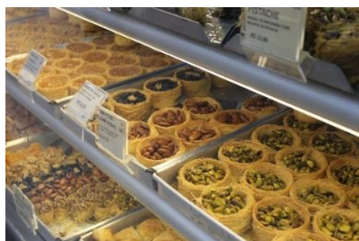
Figura 55 Estufa de exposição dos tradicionais doces árabes. Restaurante Raful. Freguesia da Sé – SP