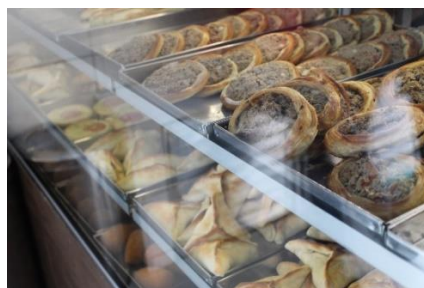
Figura 56 Estufa de exposição das esfihas e kibes. Restaurante Raful. Freguesia da Sé – SP