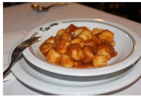
Figura 45 Prato Gnocchi finalizado, na Cantina C... Que Sabe! Freguesia do Bixiga