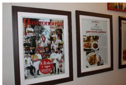
Figura 47 Cadernos de Gastronomia referindo-se à culinária italiana no bairro. Freguesia do Bixiga – SP