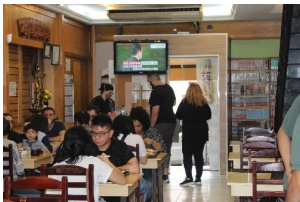
Figura 25 Visão geral do salão do restaurante Porque Sim. Freguesia da Liberdade – SP

uma estante cuja finalidade era abrigar diversos exemplares de mangás e livros escritos na língua nipônica (ver figuras 25, 26 e 27).