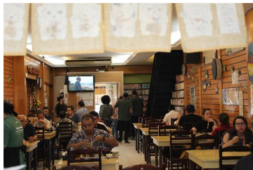
Figura 29 Visão da cozinha do restaurante Porque Sim e Clientes. Freguesia da Liberdade – SP