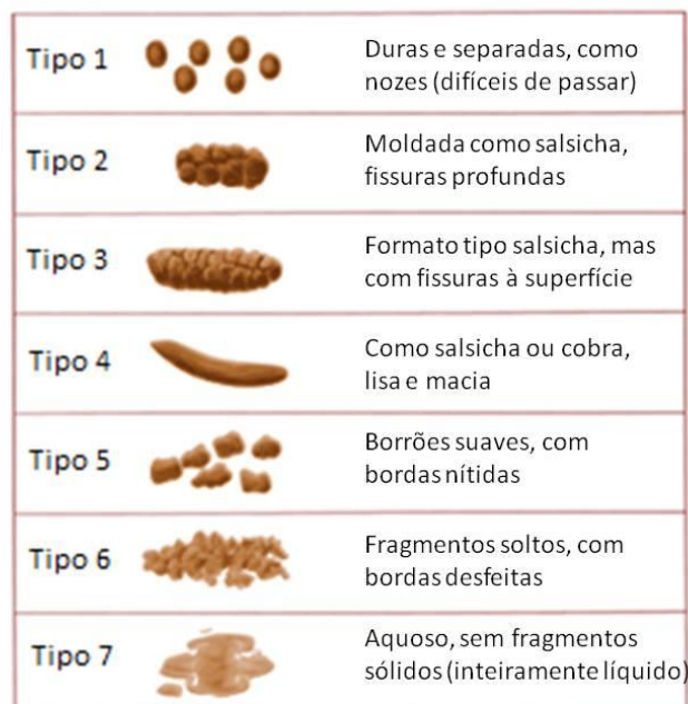
Figura 1 - Escala de Bristol para forma das fezes. Adaptada de Lewis and Heaton (1997)

† Tipo 6-7 da escala de Bristol para forma das fezes