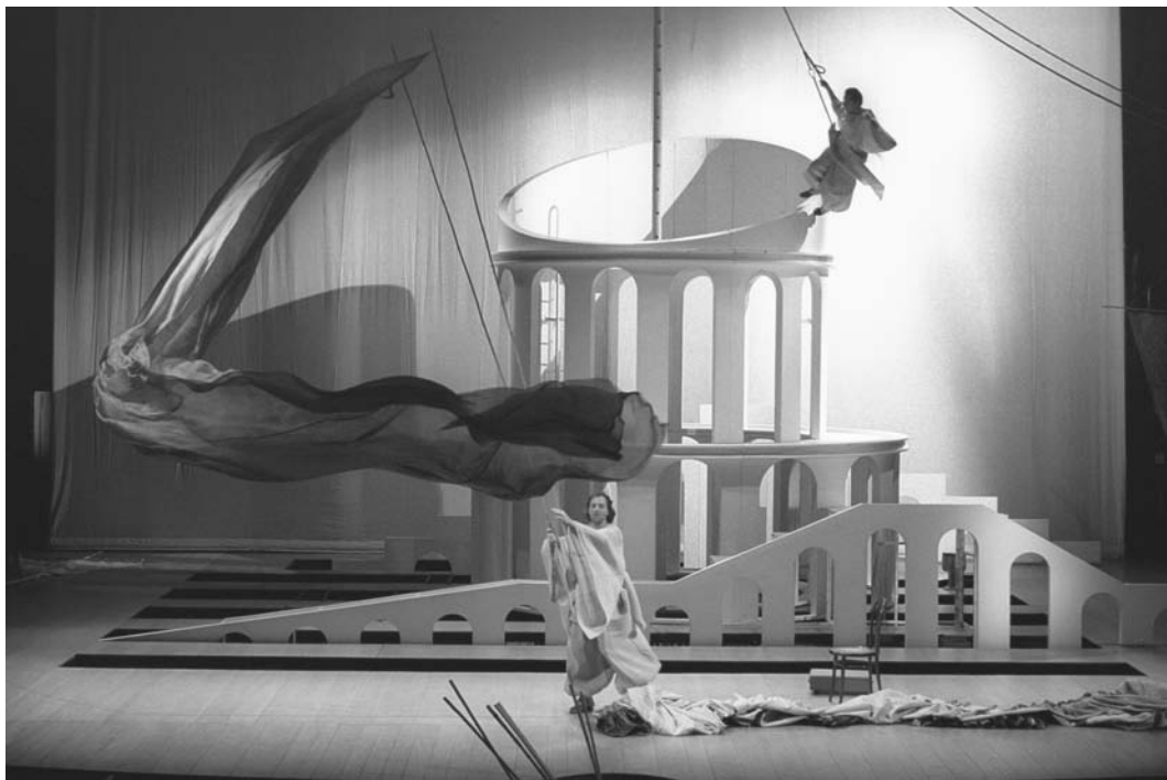
«Amphitryon» Molière/Anatoli Vassiliev, Comédie-Française, 2002, 7

O periódico Les Incorruptibles registará o esmero do encenador russo, «personnalité incontournable, artiste visionnaire et théoricien de la scène», no verdadeiro laboratório que monta sobre Amphitryon , a partir do seu espectáculo no Festival de Avignon em 1999 e da sua proposta de um fraseado inesperado na boca de Valérie Dréville, antes de a projectar, três anos mais tarde, para os bastidores do Français 8 . «Le Figaro» notará a irritação da forte personalidade com a mediocridade, humilde, no entanto, perante o génio do escritor que inclui num círculo eleito de Slavkine, Pirandello, Thomas Mann, Muller, Tchekhov, Dostoievski, Ostrovski, Lermontov, Pouchkine, ainda Platão, Dumas e Maupassant, na linha cronológica do seu próprio trabalho 9 . Antiteórico, conforme Vassiliev se apresenta em aden , descobre-se na prática retomada até à exaustão, única forma da pesquisa autêntica, e na liberdade com que lê os autores, arrancados à carga histórica que os emudece,