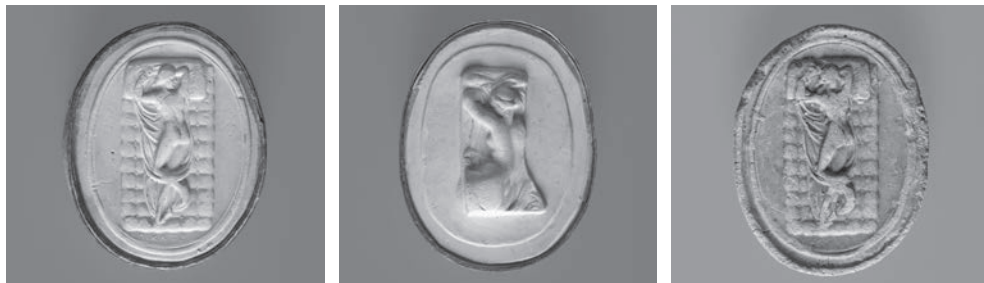
Fig. 1a-c. Hermafrodita em gesso patinado e terracota.