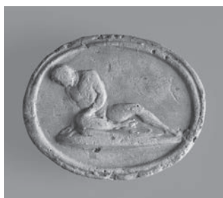
Fig. 4c. Gálata Moribundo em terracota.