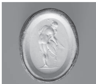
Fig. 4d-e. Leda e o Cisne em gesso patinado e terracota.