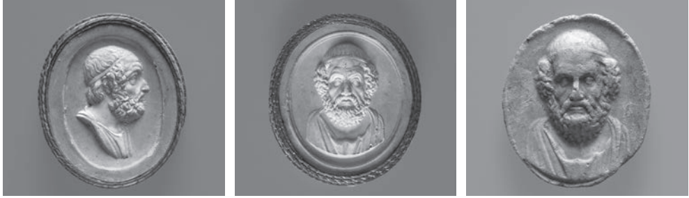
Fig. 5a-c. Busto de Homero em gesso patinado, terracota e gesso patinado rosa.