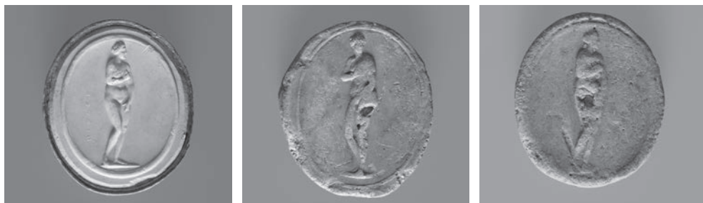
Fig. 2a-c. Vênus de Médicis em gesso patinado e terracota.