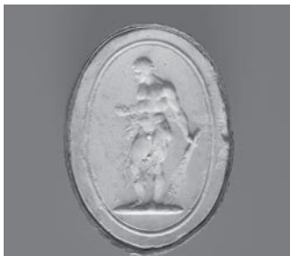
Fig. 3b. Hércules do Teatro de Pompeu em gesso patinado.