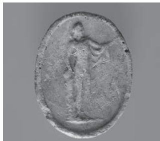
Fig. 3c. Apolo Belvedere em terracota.