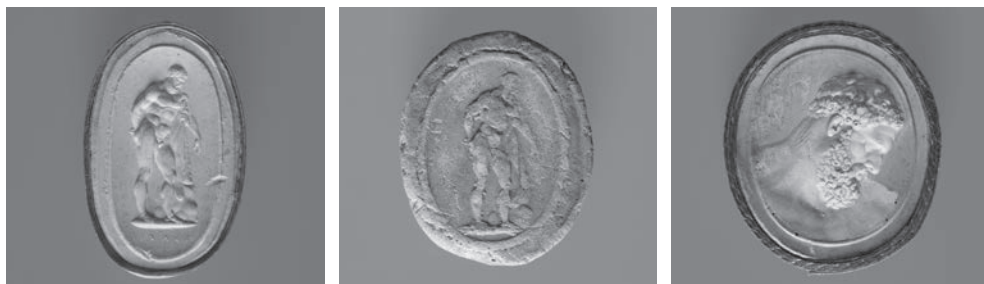
Fig. 2d-f. Hércules Farneso em gesso patinado, terracota e gesso patinado rosa.