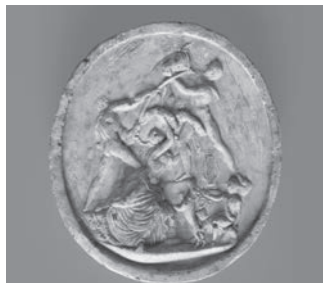
Fig. 3a. O Touro Farnese em gesso patinado.