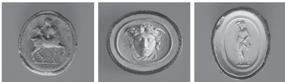
Fig. 1d. Velho e o Jovem Centauro em terracota.