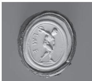
Fig. 3d-e. Discóbolo de Míron em gesso patinado.