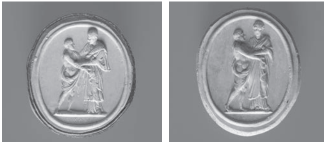
Fig. 5d-e. Grupo Ludovisi em gesso patinado; Orestes e Electra em gesso patinado.