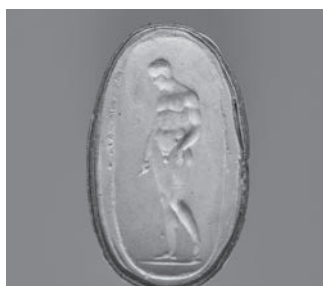
Fig. 4a. Apolo do Ônfalo em gesso patinado.