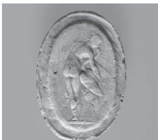
Fig. 4f. Eros e Psique em terracota.