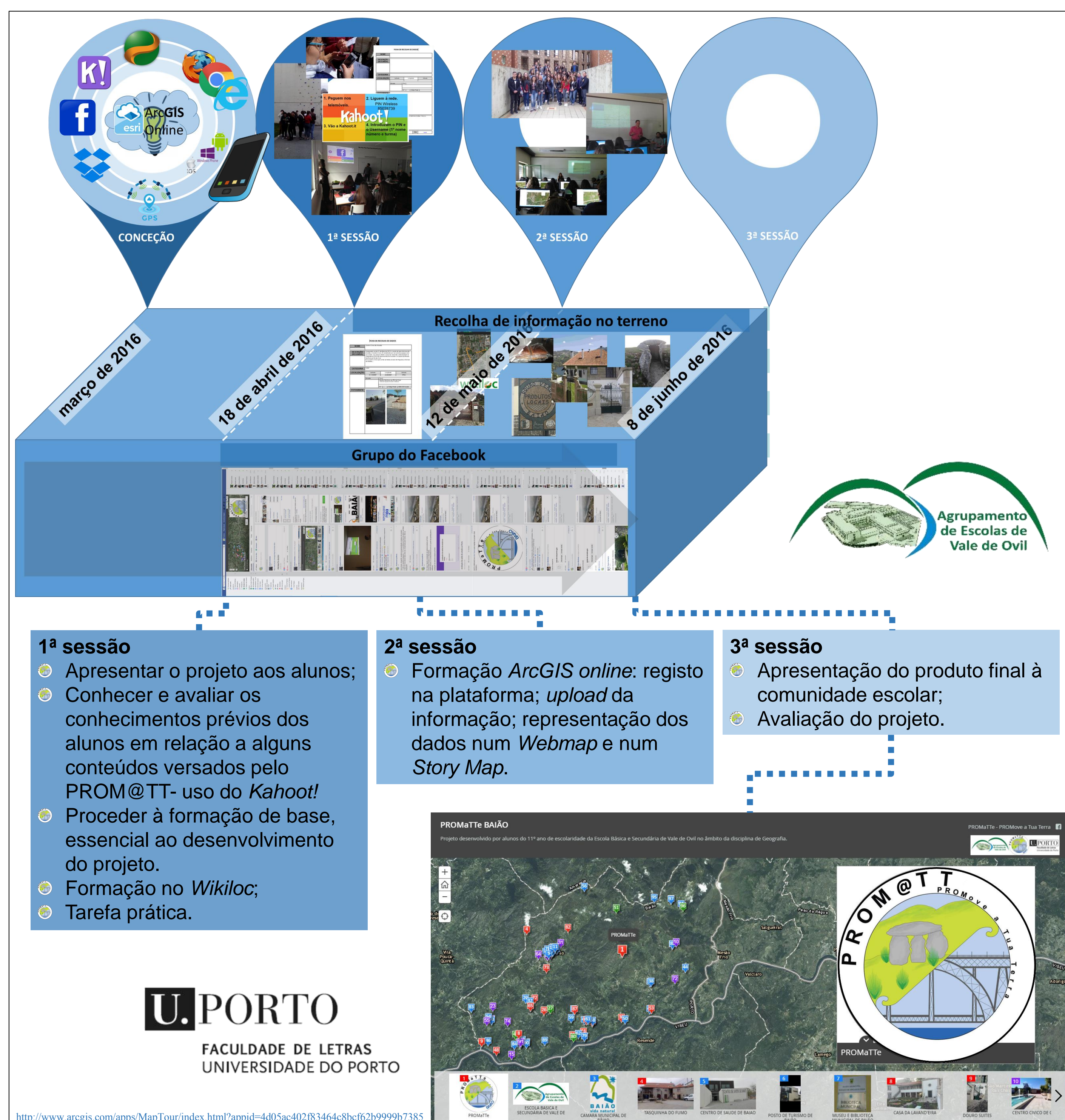
Fig.1 O processo de desenvolvimento do PROM@TT

O PROM@TT foi implementado em duas turmas do 11 o ano do Curso Científico-Humanístico de Línguas e Humanidades, da Escola Secundária de Vale de Ovil, Baião e desenvolvido pelos professores de Geografia.