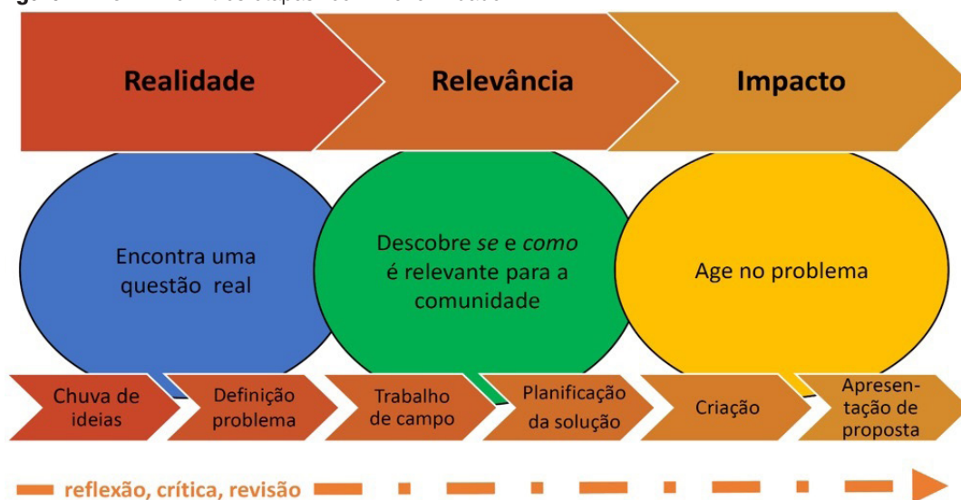
Figura 1 – O PBL em três etapas “com” reflexividade