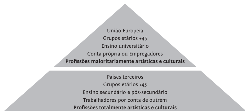
FIGURA 5 Segmentação sociodemográfica e profissional dos grupos de profissionais maioritária ou totalmente artísticos, 2011*

Assim, de 2001 para 2011 o campo dividiu-se naquilo que parecem ser, por um lado, movimentos migratórios mais antigos e/ou de indivíduos mais velhos, mais formalmente escolarizados, com maior tendência para exercer a sua atividade por conta própria ou como empregador e oriundos da UE (MAC); e por outro, movimentos migratórios mais recentes e/ou de indivíduos mais jovens, sem um nível de escolaridade superior e a exercerem atividade profissional por conta de outrem (TAC) (Figura 5). Esta dicotomização traduz-se