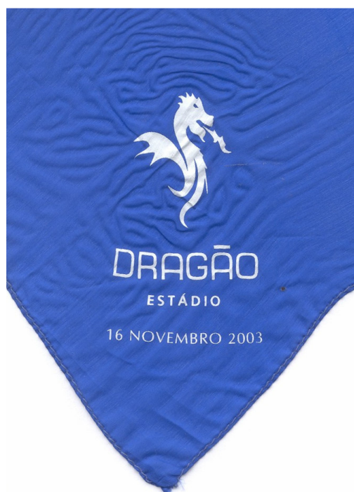
O Lenço do Adolfo