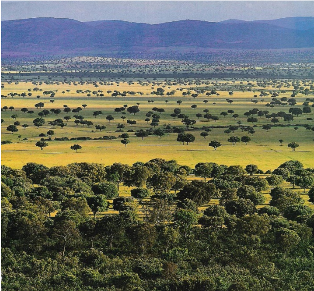
Montado de sobreiros.

É preciso ter em particular consideração a procura de madeira necessária à construção das frotas das expedições dos Descobrimentos e comerciais, a partir dos séculos XIV-XV. As preocupações régias acerca da falta de «madeira grossa» e da extensão dos «incultos» serão permanentes durante os séculos seguintes.