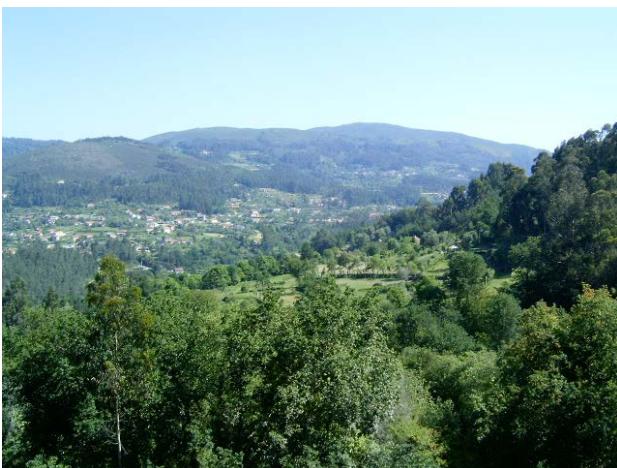
Paisagem agroflorestal em Vila Verde

Existe uma sombra neste quadro: todo este demorado processo desenvolve-se ao lado do fomento da política de planeamento territorial: a Lei de Bases de Ordenamento do território é aprovada