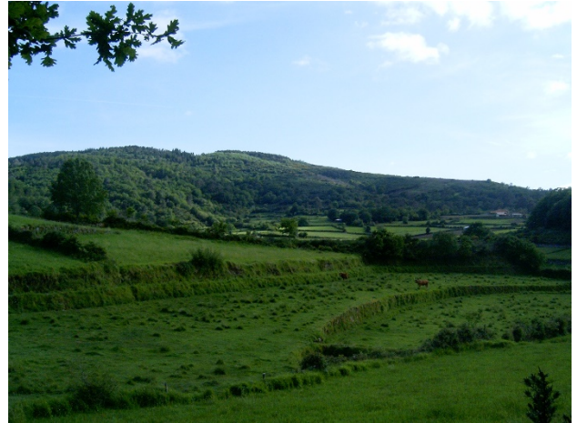
Corno de Bico – paisagem protegida.

Relendo a parte que se refere ao papel da ação humana na geografia da floresta ao longo do tempo, arrisco-me a dizer que ainda se mantêm os grandes traços da evolução, mas, claro, com a necessária atualização. Trabalhos arqueológicos e paleoecológicos deram novos contributos sobre a precocidade das interferências humanas nas dinâmicas naturais do ambiente. Na minha opinião, isto vem reforçar a ideia de que a evolução da floresta pode perspetivar-se à luz de um modelo complexo onde se articulam dinâmicas naturais e intervenções humanas, e não apenas através do modelo da floresta primitiva – a floresta autóctone de espécies caducifólias e marcescentes de Quercus e de Pinus (pinheiro bravo e manso), que teria existido antes da sua modificação e degradação pelas sociedades humanas. Na perspetiva do modelo complexo, a ação humana é encarada como parte integrante da longa evolução dos ecossistemas, quando surgem os primeiros sinais (com uso do fogo) dos seus impactes.