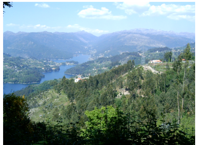
Paisagem da Caniçada – Gerês

Floresta, uma riqueza mágica? Ajudemos a natureza a reinventar a magia da floresta. Novos rebentos verdes já estão a colonizar as cinzas das áreas queimadas. Trabalhemos juntamente com a natureza, nas instituições e escolas, nos medias e gabinetes de estudos da cidade, como também nas vertentes e planícies dos territórios envelhecidos e despovoados, rompendo com a dicotomia mundo rural versus mundo urbano. Esta dicotomia é uma visão distorcida da realidade social contemporânea, contrária aos valores da interdependência e da coesão territorial.