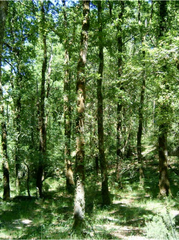
Mata de Albergaria, Gerês.

Relendo a parte que se refere ao papel da ação humana na geografia da floresta ao longo do tempo, arrisco-me a dizer que ainda se mantêm os grandes traços da evolução, mas, claro, com a necessária atualização. Trabalhos arqueológicos e paleoecológicos deram novos contributos sobre a precocidade das interferências humanas nas dinâmicas naturais do ambiente. Na minha opinião, isto vem reforçar a ideia de que a evolução da floresta pode perspetivar-se à luz de um modelo complexo onde se articulam dinâmicas naturais e intervenções humanas, e não apenas através do modelo da floresta primitiva – a floresta autóctone de espécies caducifólias e marcescentes de Quercus e de Pinus (pinheiro bravo e manso), que teria existido antes da sua modificação e degradação pelas sociedades humanas. Na perspetiva do modelo complexo, a ação humana é encarada como parte integrante da longa evolução dos ecossistemas, quando surgem os primeiros sinais (com uso do fogo) dos seus impactes.