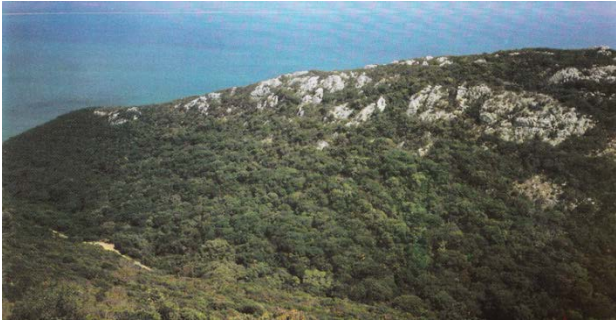
Mata da Solitária (Parque Natural da Serra da Arrábida).

ocupando largas extensões até aos arroteamentos da Baixa Idade Média?