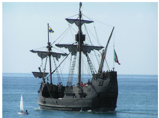
Caravela reconstituída que se encontra no Parque das Nações em Lisboa

Nos finais do século XIII, os efeitos da desarborização tornam-se uma preocupação permanente, até à crise da falta de madeira e de lenha em meados do século XIV.