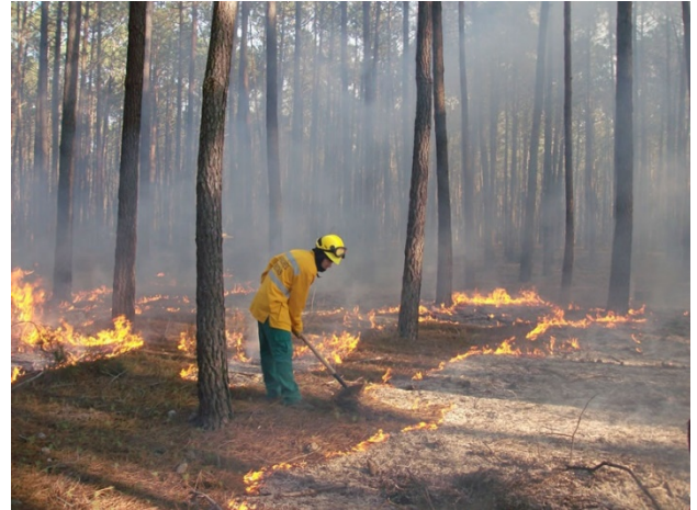
Fogo controlado num pinhal

Já se conhecem os efeitos do envelhecimento da população e do despovoamento rural: a acentuada quebra da gestão ativa das terras ou o abandono; a acumulação de biomassa ao longo dos anos, em áreas muitas vezes inacessíveis, aumentando o risco dos incêndios de vegetação; a maior vulnerabilidade dos solos à erosão hídrica. De tal modo que, principalmente no norte e centro do país, os riscos de incêndio estão a tornar-se um forte constrangimento aos investimentos e à inovação na gestão activa dos territórios.