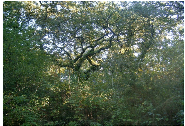
Mata de carvalho português – Sítio classificado do Monte de Ferrestelo

As transformações ambientais ocorridas na Idade Média constituem outra etapa fulcral da ação humana. O recuo da floresta constitui um fenómeno geral em muitas áreas da Europa meridional, principalmente nos séculos XI-XIII. Em Portugal, há então uma rutura irreversível: a floresta deixa de ser «natural», no sentido absoluto em que geralmente se entende. A sua evolução passa a realizar-se através de um estreito vínculo entre processos naturais e socioeconómicos. Organizam-se os espaços agro-silvo-pastoris, enquanto a Reconquista avança até ao Algarve.