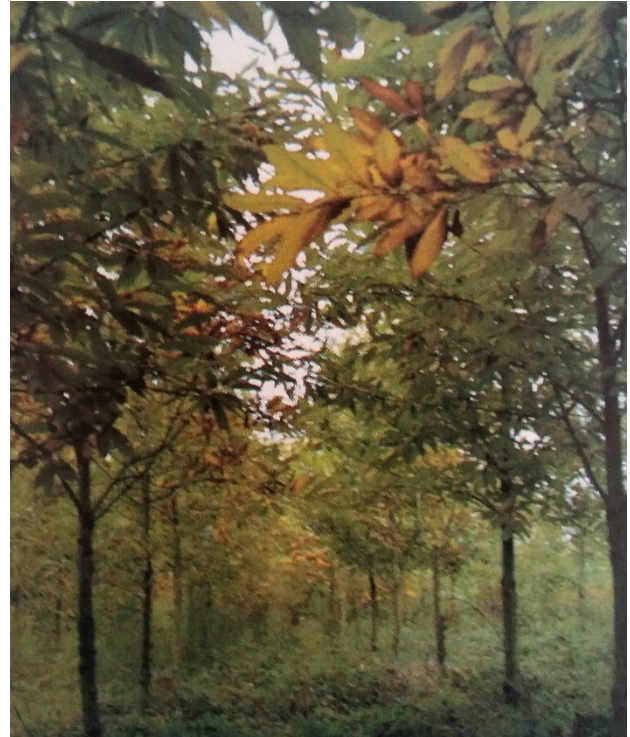
Fuste de castanheiro

dá uma grande importância ao risco de incêndio. Risco não só em termos económicos, mas também em termos sociais. O futuro da floresta passa pela diminuição do risco de incêndio.