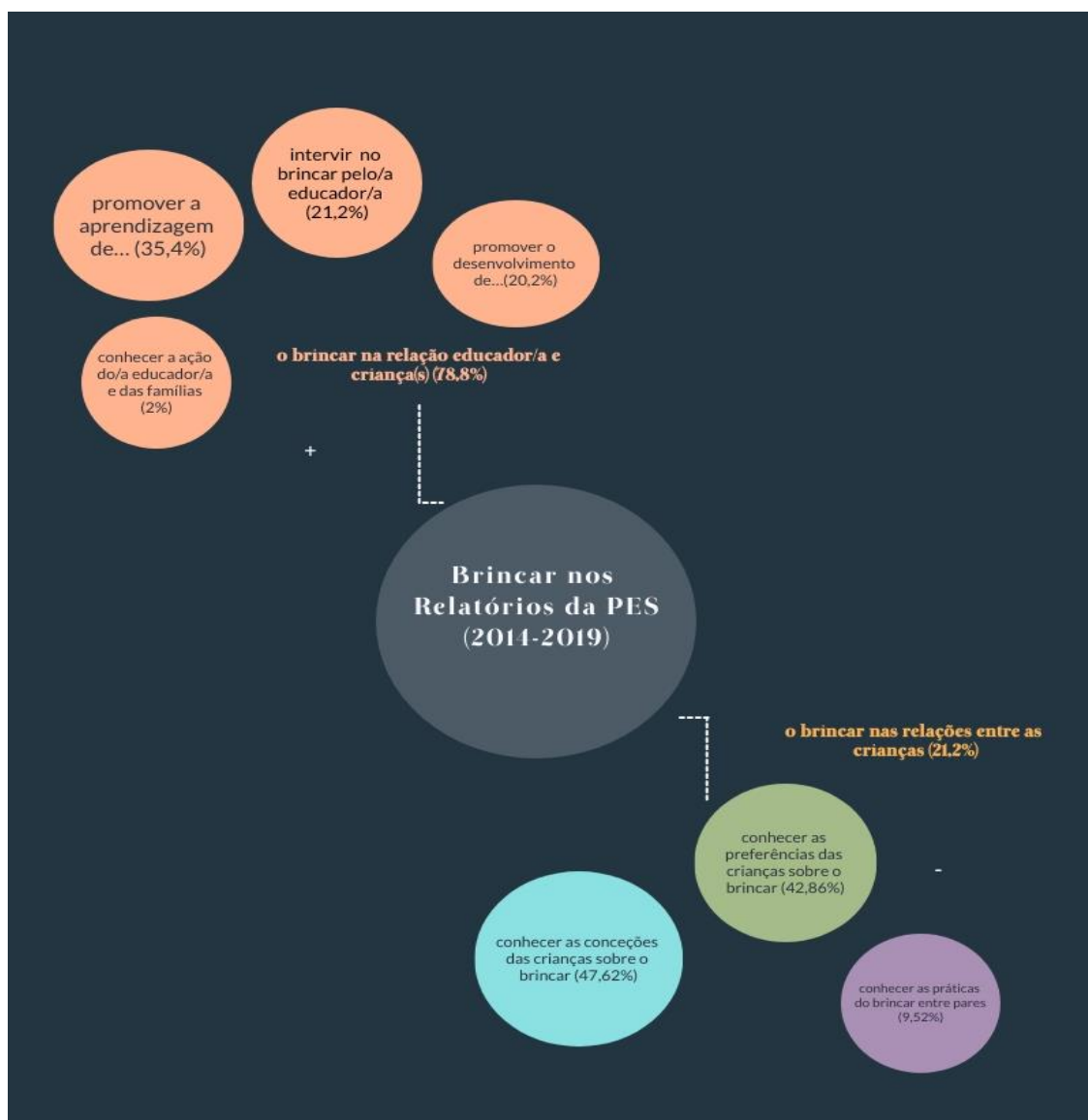
Figura 2 – Relatórios PES sobre o brincar na EI (2014-2019): relações educador/as-crianças e entre crianças e temáticas – síntese

Fonte: Relatórios PES na EI (2014 -2019)