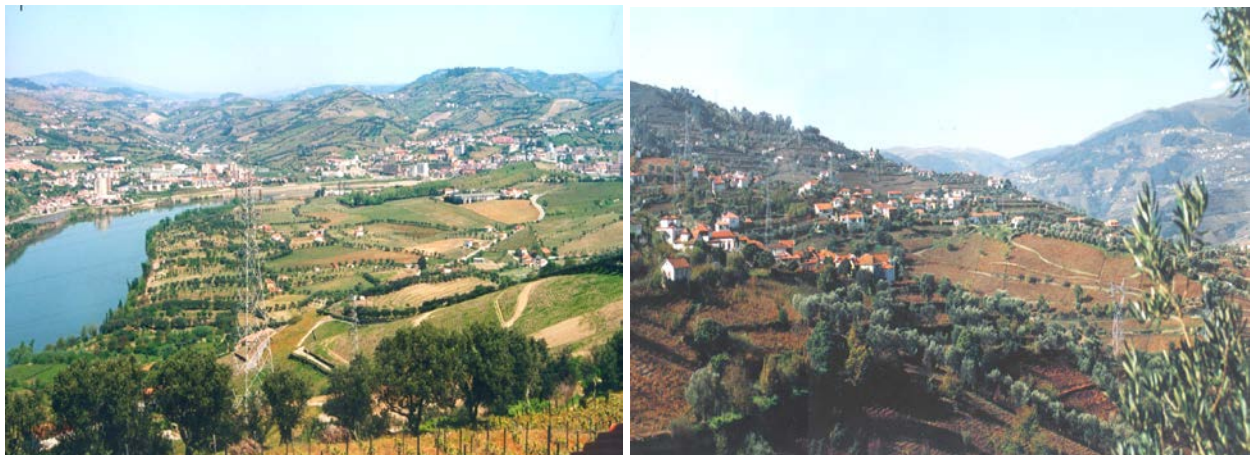
Fotos 1 e 2 - Alguns aspetos da freguesia de Cambres (vista parcial)

Freguesia do concelho de Lamego (NE de Portugal) espraia-se por uma área que totaliza 11,16 Km 2 , ascendendo na vertente desde a margem esquerda do rio Douro fronteira a Peso da Régua, até atingir o limite norte da cidade de Lamego, a cerca de 440 metros de altitude. Neste cenário multiplicam-se os socalcos de vinhedos tradicionais, muito exigentes em mão-de-obra, mas também os socalcos que recentemente sofreram uma reestruturação e a consequente mecanização, uma das formas de ultrapassar a carência de assalariados e o elevado nível retributivo que lhe está associado. Domina, contudo, um quadro natural apelativo, de substrato xistoso e clima de cambiante mediterrânea, onde o povoamento disperso e a persistência de outras culturas como a oliveira, a delimitar os blocos agrícolas, justificam a permanência de uma biodiversidade com raízes históricas e, com esta estratégia, a manutenção de um património paisagístico único (fotos 1 e 2).