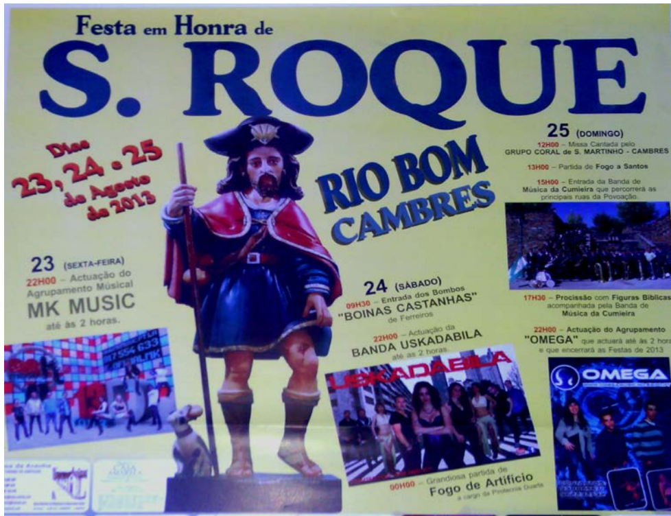
Fig. 4- Programa das festas de S. Roque (2013).

Lugar atravessado por um “Caminho de Santiago”, envolto por vinhedos, os seus residentes após uma longa interrupção, recuperaram a festa ao santo padroeiro, S. Roque. Estávamos em 2012. Incumbência de um só residente, transmitiu a realização dos festejos de 2013 a uma comissão constituída por mulheres jovens residentes no lugar, a exercerem as suas atividades nos núcleos urbanos envolventes da freguesia. Dinâmicas, recuperaram a apresentação oficial da lista de festeiros ao pároco no final da missa solene, proposta que seria confirmada (ou não...) no final dos festejos quando a banda musical termina a sua atuação em frente à residência do proposto presidente das festas do ano seguinte. Caso aceite, estão assegurados os festejos do ano seguinte, estruturando-se os eventos para a angariação dos fundos necessários (patrocínios, leilões mensais realizados no largo da capela, ...).