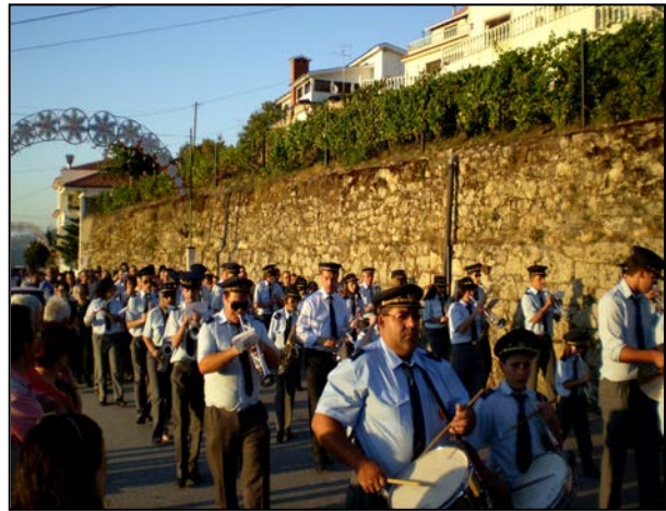
Fotos 3 e 4 – Algumas imagens da procissão triunfal e da banda filarmónica

Evolução distinta sofreram, porém, os restantes festejos associados aos santos e capelas dispersas pela freguesia: sucumbiram! Num espaço onde o declínio demográfico é notório, persistindo apenas os idosos, estes, embora colaborem com todas as iniciativas associadas às festas do Senhor da Aflição (peditórios, leilões e outros eventos), não tomam a iniciativa de reativar o do santo do lugar onde residem. Apenas ocasionalmente acontece, e sempre nos lugares de maior dimensão, como foi o caso de Rio Bom em 2012 e 2013 (figura 4).