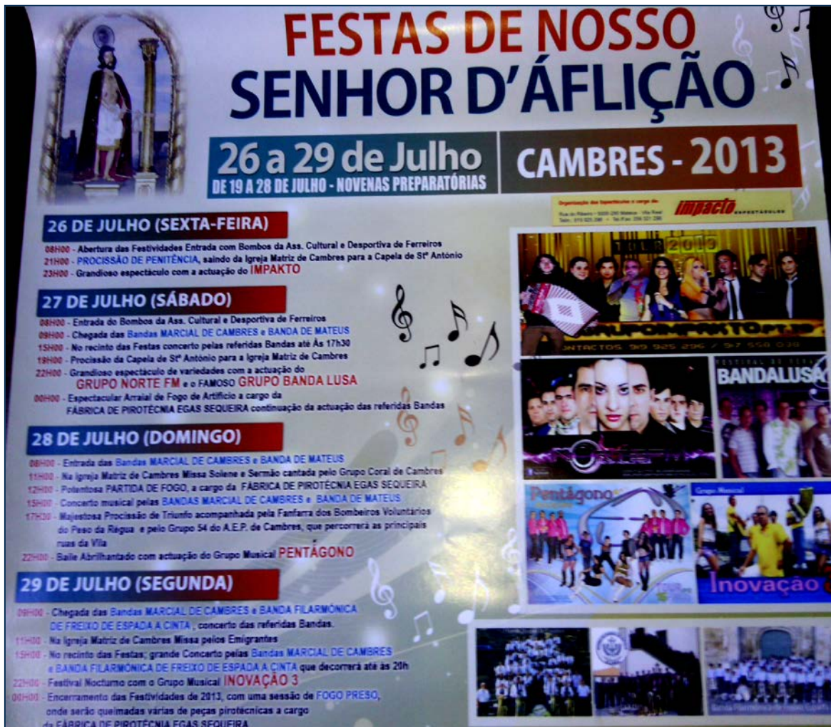
Fig 3 – Programa das festas de 2013

programa das festas de 2013 (Fig. 3) destacava-se a vertente lúdica e musical, enquanto o valor dispensado às bandas filarmónicas se restringia, embora permanecendo significativo.