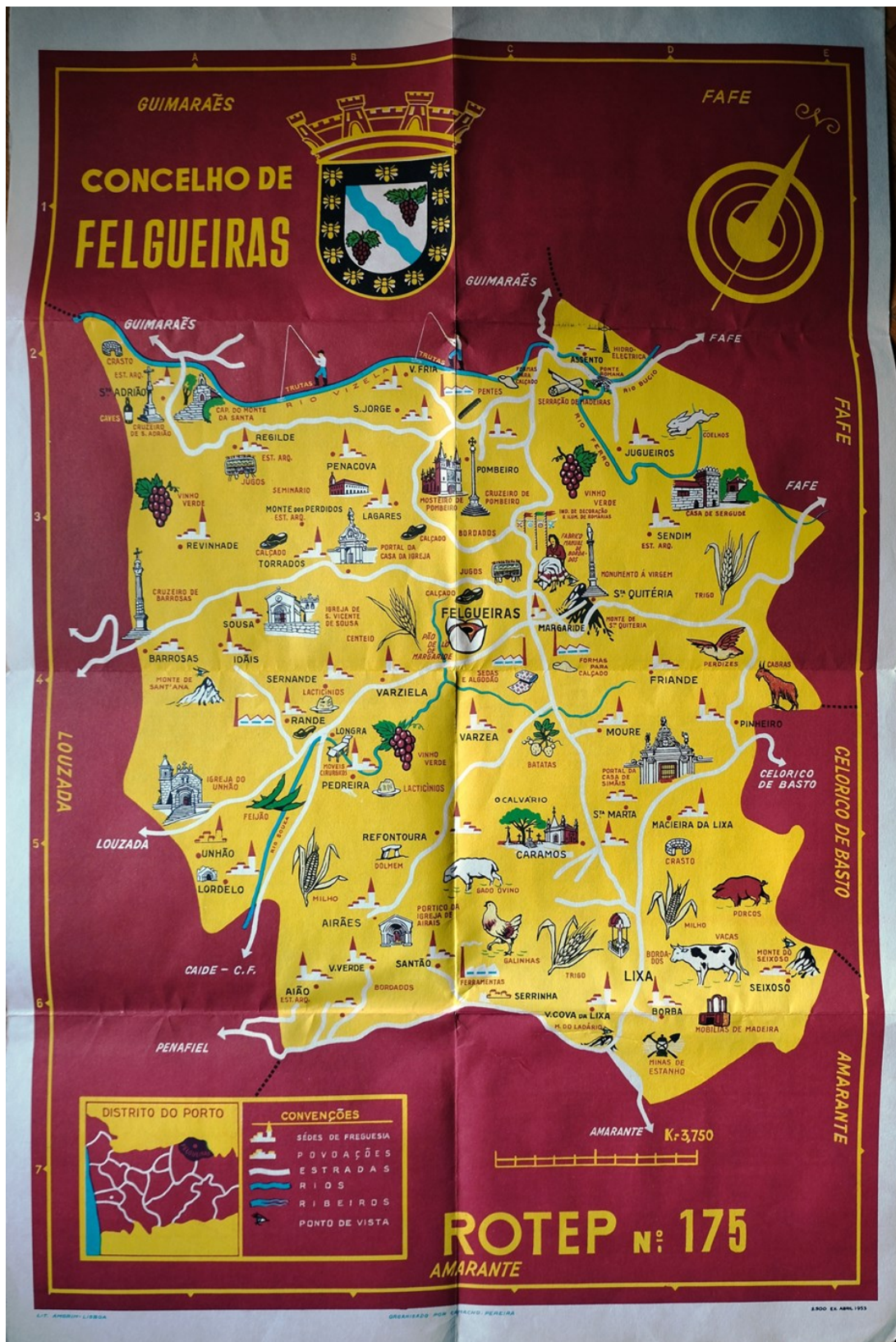
Figura 4. Imagem extraída do ROTEP nº 175 (Felgueiras).