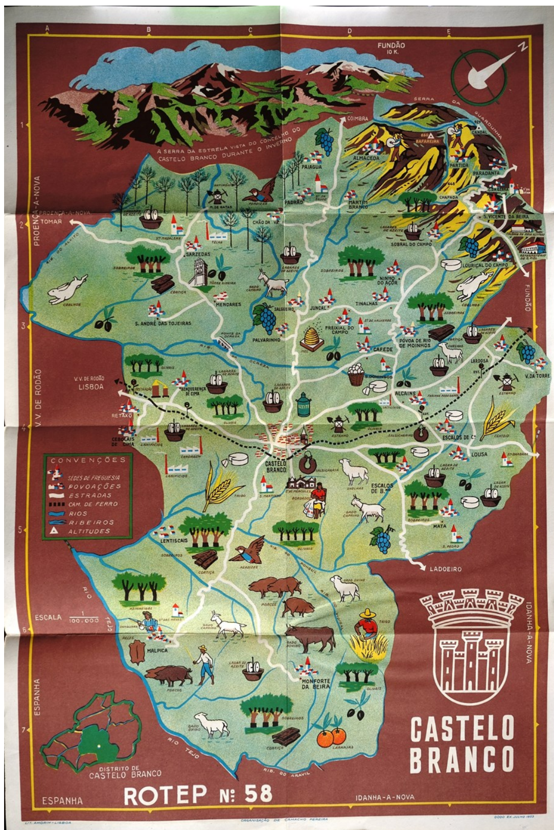
Figura 3. Imagem extraída do ROTEP nº 58 (Castelo Branco).