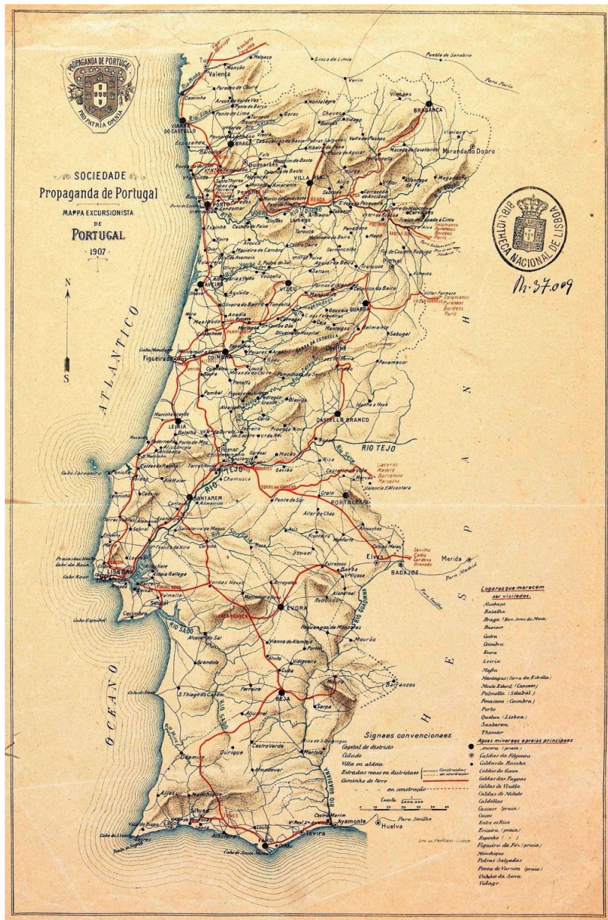
«Mapa excursionista de Portugal 1907»

AUTOR(ES): Sociedade de Propaganda de Portugal / ESCALA: 1:2000000 / PUBLICAÇÃO: Lisboa: Lith de Portugal, 1907 / DESCR. FÍSICA: 1 mapa: litografia, color.; 32,00x20,20 cm em folha de 32,90x21,80 cm NOTAS: Contém escala gráfica de "60" Km. CDU: 796.5(469)"1907"(084.3) / 914.69(084.3) / 912"19"(084.3).