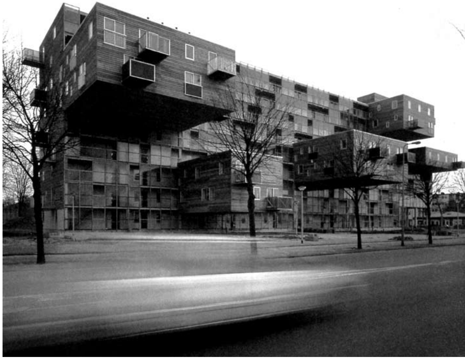
MVRDV, 100 habitações para idosos, Amsterdã-Osdorp, 1994-97. [Zodiak, n.º 8, 1992]

mrvdv que recuperam o protótipo de Moshe Safdie, habitat na expo 67 em Montreal, que parecem sugerir nos pisos elevados a ideia de pátio ou de terraço; ou ainda pela dilatação da perspectiva como espaço virtual da casa, já assinalados nos projectos do case study house com a legendária imagem da casa #22 de Pierre Koenig que estende o espaço visual sobre o horizonte de Los Angeles incluindo-o como se tratasse do seu espaço exterior.