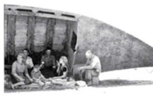
3 - Vareiros do Furadouro