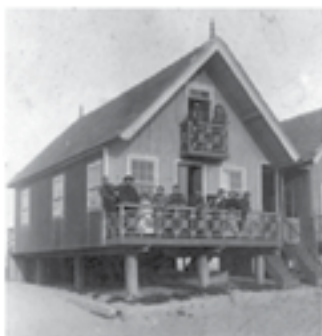
6 - Palheiro em Esmoriz, 1914