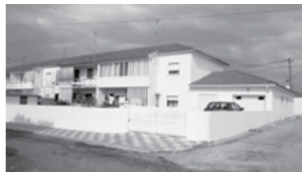
18 - Bairro dos Pescadores da JCCP em Ílhavo na atualidade