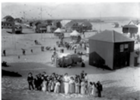
5 - Época balnear em Esmoriz, 1907