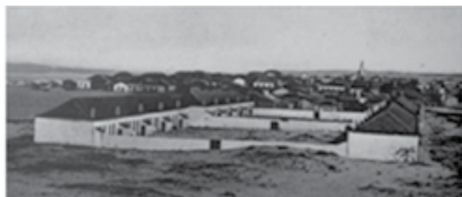
8 - Bairro da Rainha em Espinho