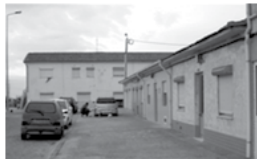
20 - Bairro da JCCP em Espinho