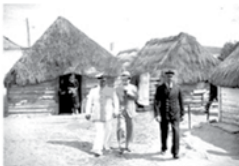
15 - Comandante Tenreiro visita o antigo bairro piscatório da Caparica em 1938