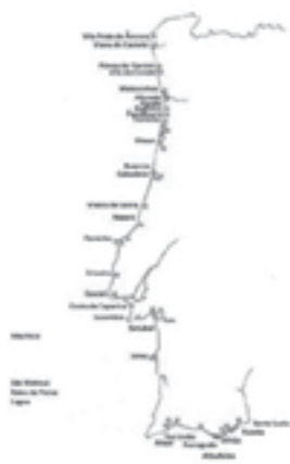
11 - Distribuição geográfica dos bairros da JCCP