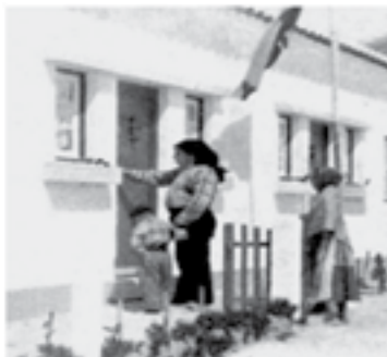
2 - Bairro da JCCP da Nazaré.