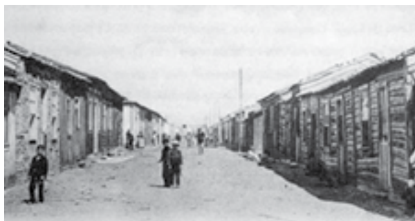
19 - Palheiros em Espinho