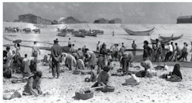
4 - Areal do Furadoiro

Os palheiros propagaram-se ao longo da costa, de Espinho a Vieira de Leiria. Na sua expressão mais elementar tinham, antes de mais, a função de abrigo e proteção contra os efeitos indesejáveis do clima, longe de qualquer preocupações de conforto, higiene ou separação funcional