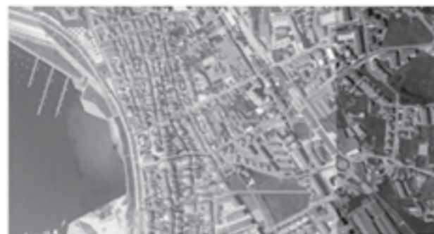
13 - Implantação do Bairro da JCCP na Póvoa de Varzim, [2012]

o ponto de partida para a organização de núcleos de apoio social em todos os centros piscatórios, o que resultou no aparecimento das entidades de apoio social, denominadas Casas dos Pescadores dirigida pela Junta Central das Casas dos Pescadores. Para além da representação profissional da classe, como elemento basilar no funcionamento da organização corporativa, geriam igualmente a sua educação, instrução, previdência e assistência.