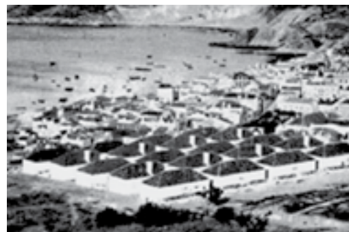
16 - Bairro dos Pescadores de Sesimbra, anos cinquenta