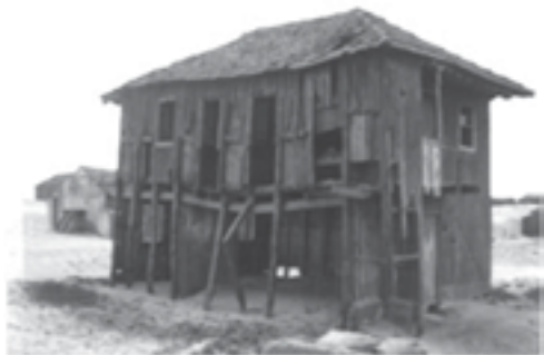
9 - Esmoriz, destruição em 1941