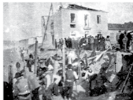
7 - Espinho, destruição em 1891