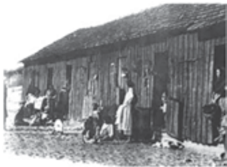
1 - Palheiros em Espinho, 1840.

A literatura sobre as primeiras comunidades piscatórias identifica características comuns como a disposição dos aglomerados e formas de associação das casas, os diferentes tipos de construção ou o uso materiais específicos. Além disto, a observação de aspetos intrínsecos da sua história revelam-nos a família, a comunidade, a terra e o mar onde se situam, tecendo uma identidade baseada no fator comum do trabalho. Assim, as construções populares são o testemunho da adequação às condições socioculturais e geofísicas, particulares e comuns, de cada local. Mas a sua expressão construtiva singela, simultaneamente complexa e banal, exemplo de um sistema derivado diretamente de uma prática piscatória e de uma prática de viver em con-