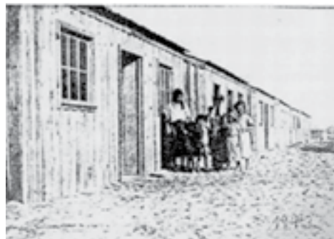
10 - Bairro de Palheiros construído pelas autoridades marítimas, Esmoriz, 1943

ma conduzem a transfigurações, acima de tudo, relacionadas com tentativas de melhoria das condições de vida e de afirmação social. As novas casas, construídas de acordo com os padrões sociais e comportamentais aceitáveis no seu tempo, acumulam marcas de processos de identitários complexos e extensos no tempo.