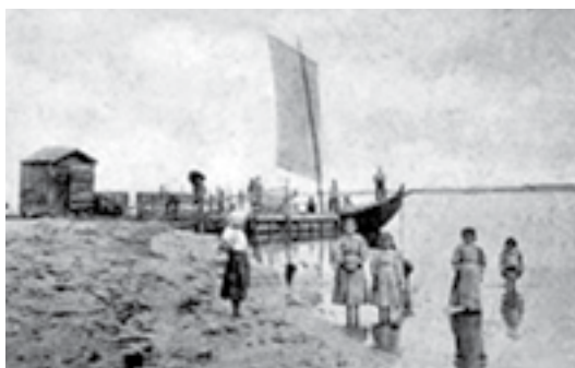
17 - Ílhavo, finais do século XIX