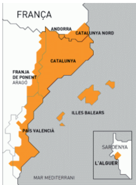
Figura 1: o território onde se fala catalão.

O processo de padronização do catalão começou no início do século XX na Catalunha, num contexto de recuperação da identidade e cultura catalãs. Os dois séculos anteriores, depois da guerra da Sucessão e da chegada de Filipe V ao trono de Espanha, o catalão, como todas as outras línguas do Estado que não fossem o castelhano, foi proibido, através dos Decretos da Nova Planta, em todos os usos públicos da língua, incluindo a Administração e o ensino.